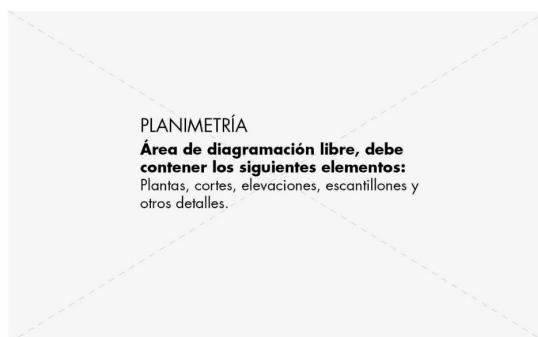
LÁMINA 1 DEL EQUIPO: ESCRIBIR EL CÓDIGO AQUÍ